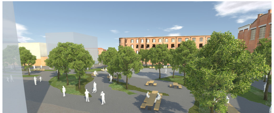
Les espaces publics qui seront réalisés à partir de mai 2016

Afin de permettre le développement de la Plaine Images, les travaux d'aménagement des espaces publics sont engagés le 9 mai 2016. Ils entraîneront la fermeture définitive de l'espace de stationnement transitoire situé face au bâtiment Jacquard, à l'intérieur du site de la Plaine Images, le 23 mai.